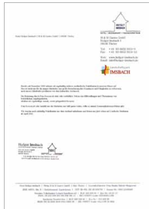
Hotel Hofgut Imsbach