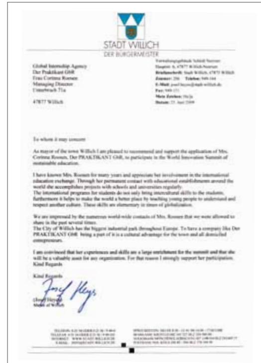
Stadt Willich – Der Bürgermeister