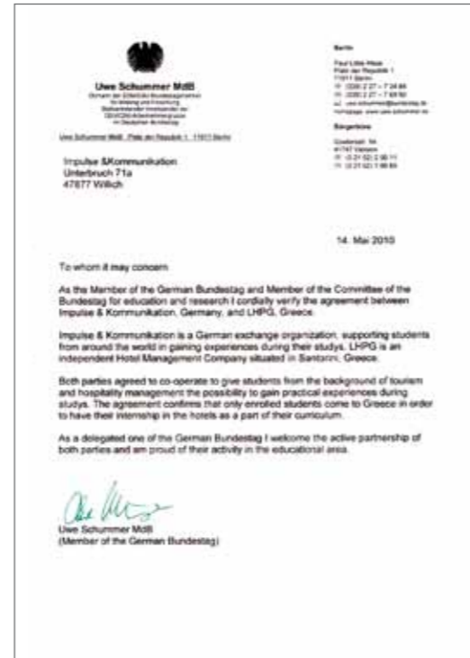
Uwe Schummer MdB